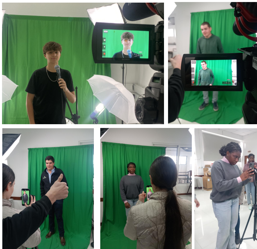
Gravação das cenas para vídeo utilizando equipamento LED

Os alunos não foram apenas espectadores, mas protagonistas na construção do conhecimento sobre segurança digital!